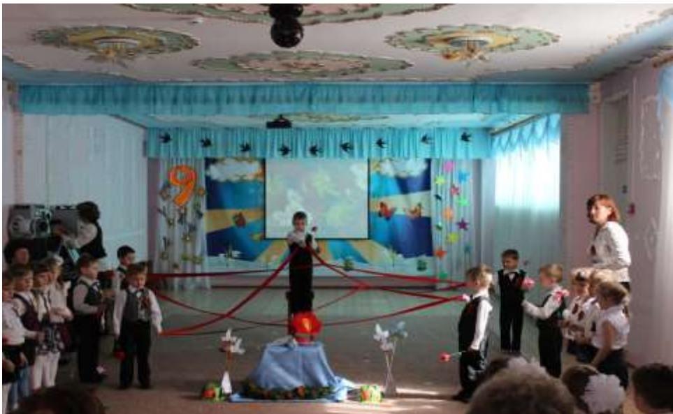
Праздник «9 МАЯ» (У нас в гостях Дети Войны)