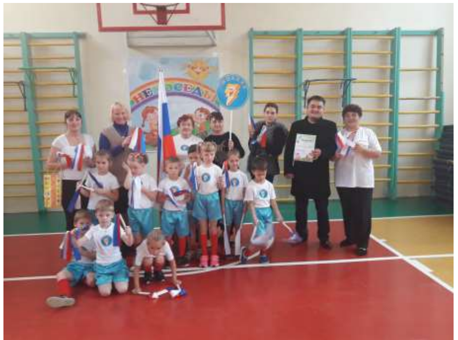
Городской конкурс «Непоседы»